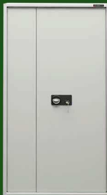
Szafy na dokumenty klasa A, B, C