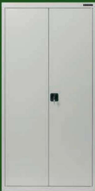
Szafy na dokumenty