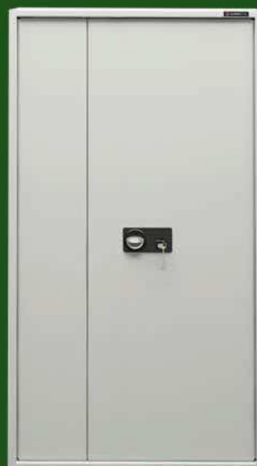
Szafy na dokumenty SD