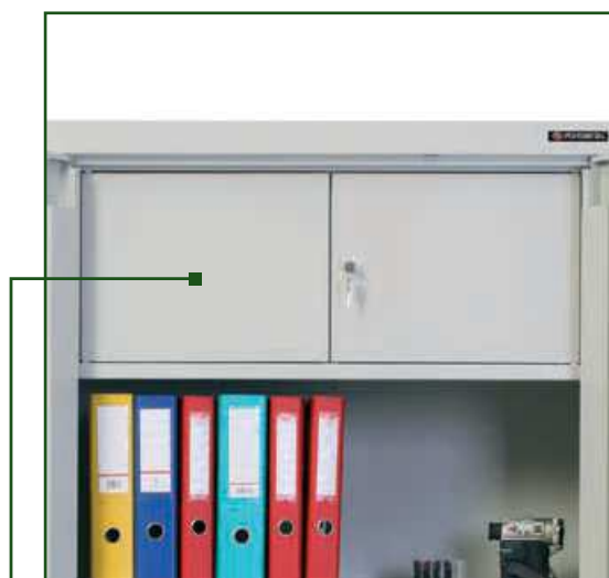
■ Funkcjonalna skrytka dwudrzwiowa

Waga produktów jest podawana w celach informacyjnych i może ulec zmianie.