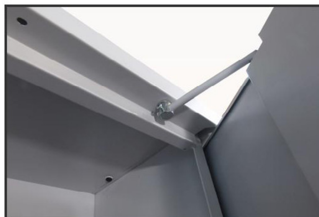
system drzwi chowanych